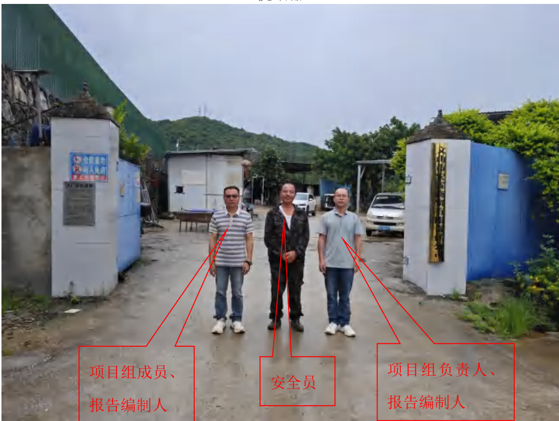
评价人员现场照片