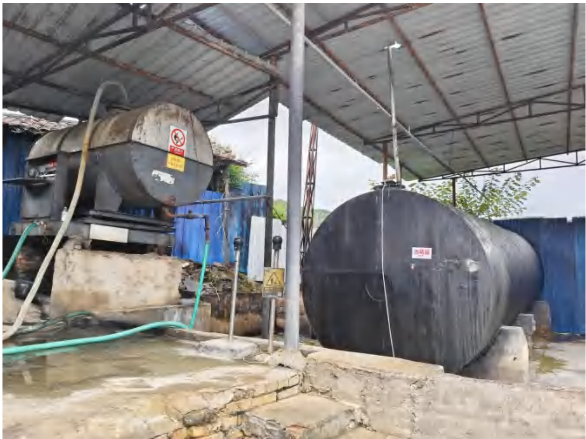
50m 3 乙醇罐