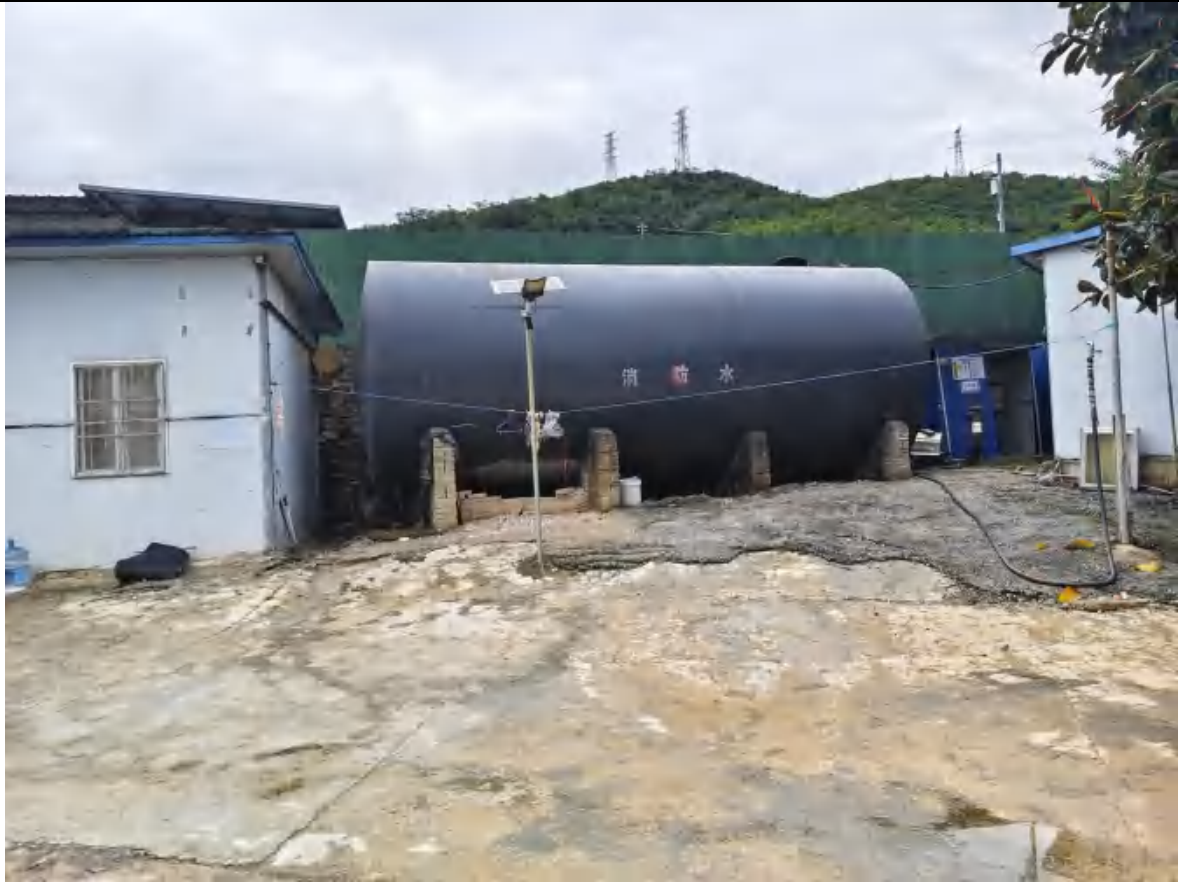
60m 3 消防水罐