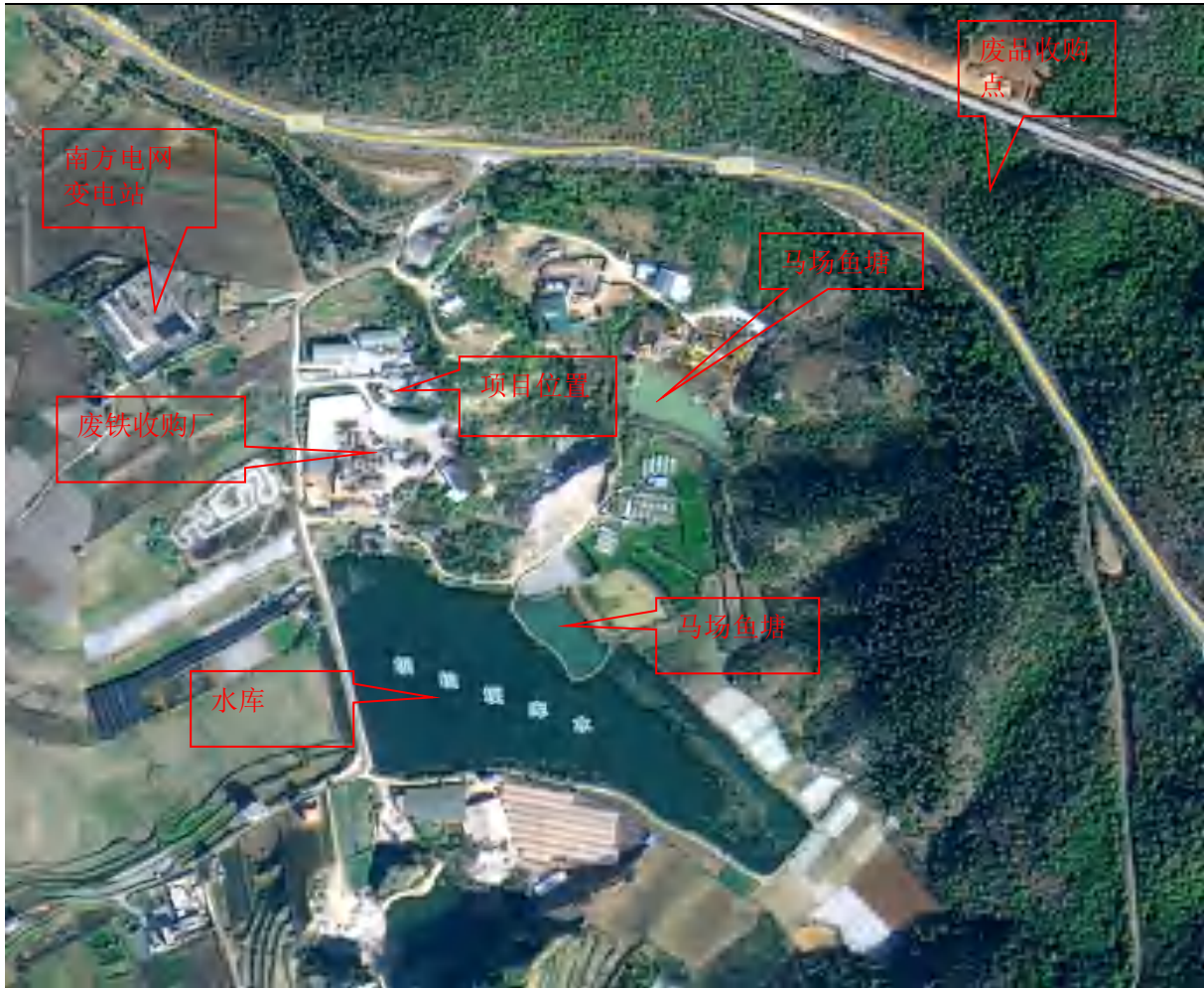
图 2-2 文山市宏霖商贸有限责任公司卫星图