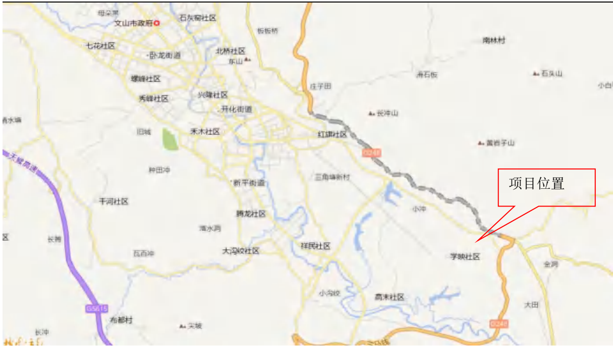
图2-1 仓库的地理位置图