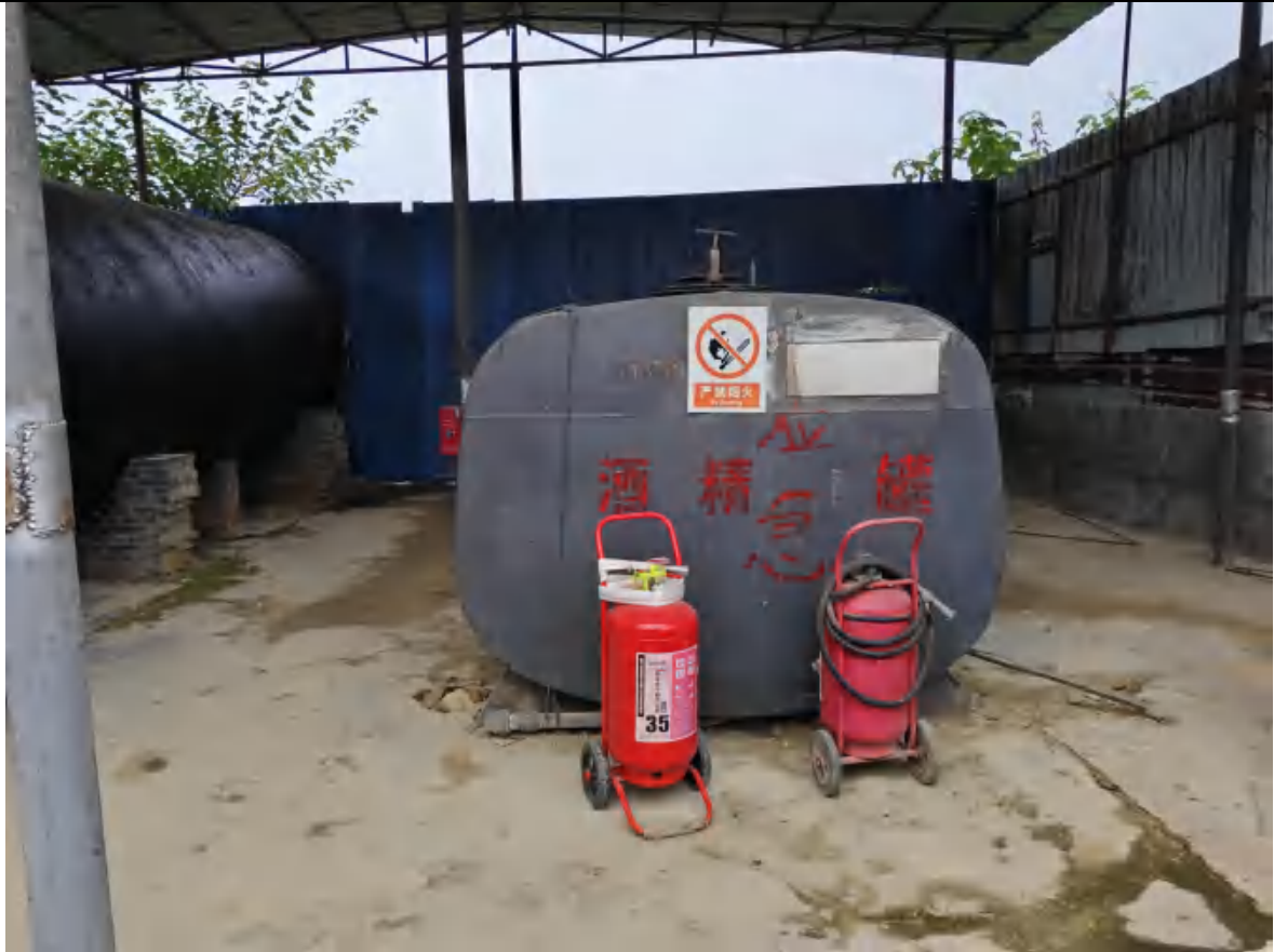
25m 3 乙醇备用罐及应急物资