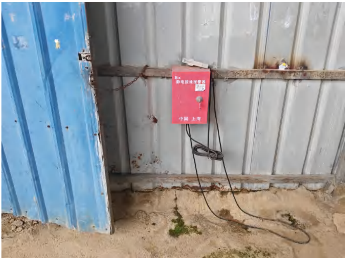
甲醇储罐区静电接地夹